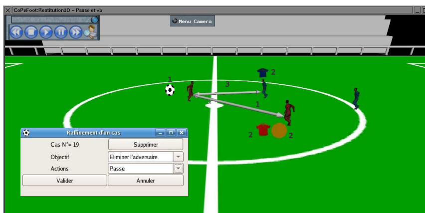
Image 2 : Représentation des perceptions d'un agent dans le contexte : point de vue exocentré.

contextuelles sont représentées par des symboles de distance par rapport à la cible, ou aux agents partenaires et adversaires; des symboles soulignent que certains partenaires sont marqués ou disponibles, etc. Grâce à cet apport d'informations graphiques, l'utilisateur « explicite » les éléments significatifs dans l'action. Les renseignements fournis par l'utilisateur en cliquant sur ces éléments, permettent de réviser les poids associés à chaque élément de contexte, selon un algorithme décrit dans (Bénard, De Loor et Tisseau, 2006 ; Bénard et De Loor, 2007). La prescription est moyenne : l'apprentissage est lié à l'imitation par les agents des comportements perceptifs des usagers.